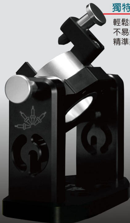
銀得勝利鎖刀座 BT30 BT40