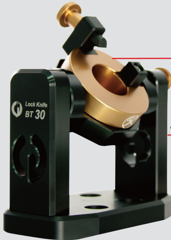
金幸福鎖刀座 BT30 BT40